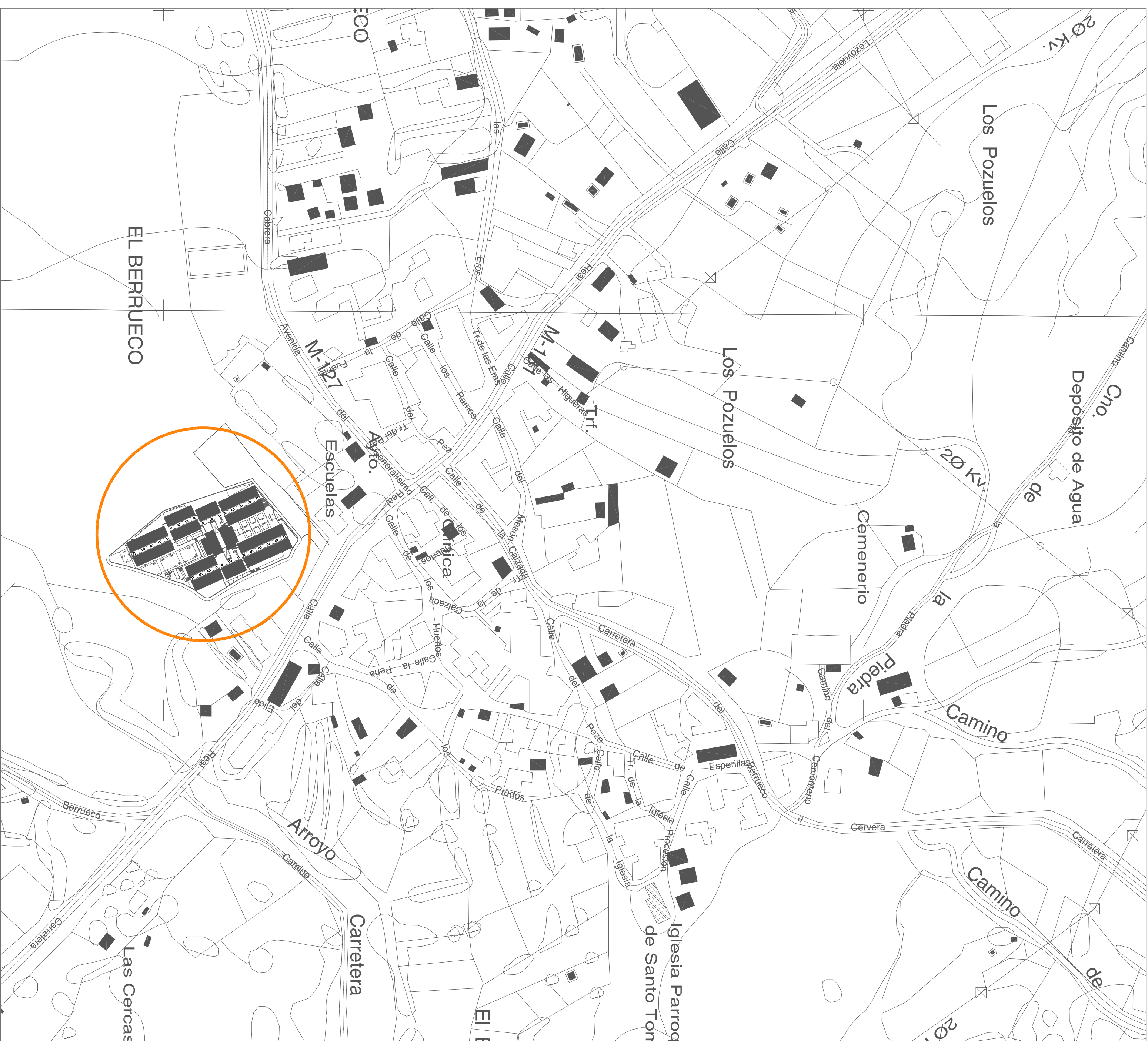
PLANO DE SITUACIÓN. E:1/2000